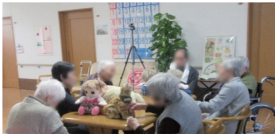
(a) ロボットとの触れ合い

介護施設では、認知症対策やQOLを高める観点から、レクリエーションが重要な役割を果たしています。本シーズは、ロボットを活用した「介護サービスの質の向上と介護職員の負担軽減を両立」させるレクリエーションプログラムです。簡単な操作で運用可能なロボットが、利用者(認知症高齢者)を引きつけます。本プログラムは、利用者のBPSDの低減や、介護職員と利用者の親密な人間関係の構築に貢献できます。