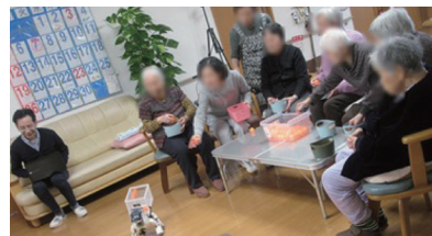
(c) ロボットとボールゲーム