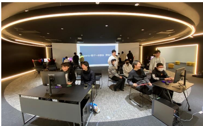
e-sports 愛好会が企画した対戦型格闘ゲーム体験会

2024年3月に完成した本学4階の「nexus for. (ネクサスフォー)」には、esports大会開催も可能な施設を完備しています。Theaterルームは大型ワイドスクリーンやレーザープロジェクタ、音響システムを備え、ライブ配信も可能です。学生は普段オンラインで練習するほか、本施設を使用してイベントや練習をしています。