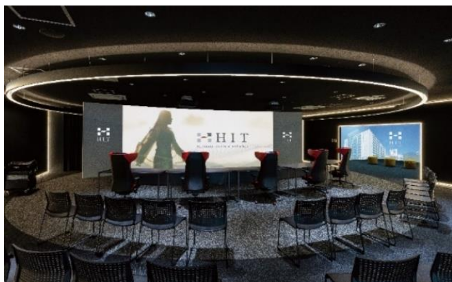
nexus for. Theater

2024年3月に完成した本学4階の「nexus for. (ネクサスフォー)」には、esports大会開催も可能な施設を完備しています。Theaterルームは大型ワイドスクリーンやレーザープロジェクタ、音響システムを備え、ライブ配信も可能です。学生は普段オンラインで練習するほか、本施設を使用してイベントや練習をしています。