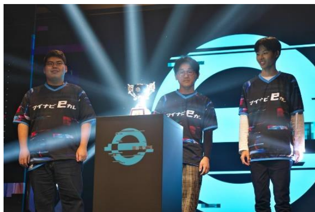
2024年大会 優勝時の様子

また、e-sports 愛好会の活動は学内にとどまらず、広島県 e スポーツ振興会や esports プロチームと連携し、イベントの実施などにも積極的に取り組んでいます。『広工大といえば esports!』『広島といえば esports!』と呼ばれることをめざし、日々活動を続けています。