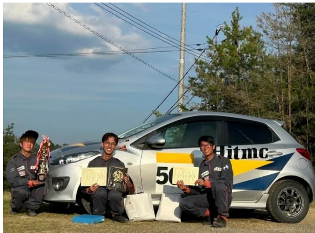
大会で使用した車両と走者 3 名