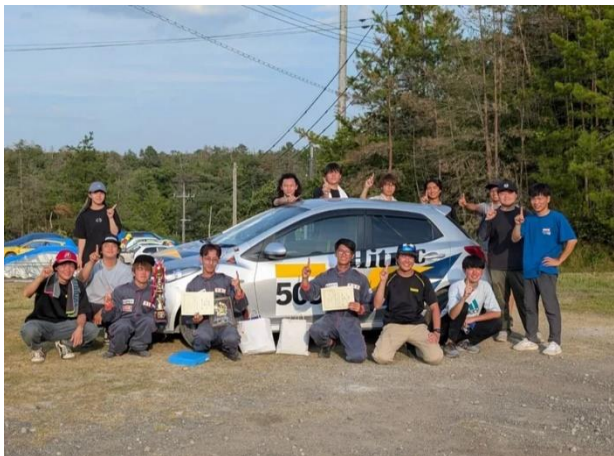
優勝を果たした自動車部の集合写真