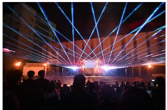
2日目のエンディングを飾るレーザーショー