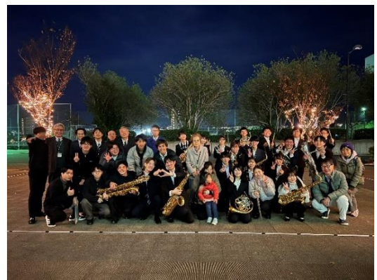
< 昨年撮影した点灯式後の集合写真 >

当日は、本学正門から守衛所までの歩道（約 100m）および Nexus21 1 階出口の木を LED でライトアップします。また、歩道にはライトアップのオブジェクトも設置する予定です。初年度となる昨年は、学生・教職員だけでなく、地域の方々にもお越しいただき、点灯の瞬間を楽しんでいただきました。