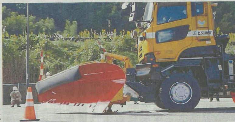
路面の構造物を避けて除雪板を上げ下げできるか確かめる実験 ＝昨年10月17日、庄原市（広島工業大菅雄三研究室提供）

広島工業大(広島市佐伯区)の菅雄三教授(68)は空間情報科学Ⅱが、除雪車の前部にある除雪板を自動で操作する技術を開発した。人工衛星で導いた車両の位置と道路の3次元情報を基に、マンホールや橋の継ぎ目など路面の構造物を避けて雪をかき分ける仕組み。作業員の熟練の技に頼っている除雪の安全性と効率性を高める技術として、数年以内の実用化を目指す。(宮野史康)